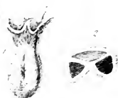
V. hamata. Bast.